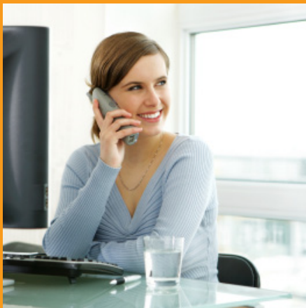
Réponse à vos questions dans les 2H